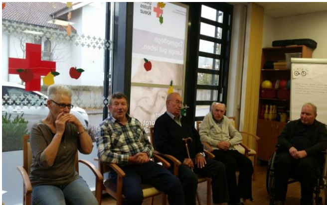
Gemeinsames Singen und Musizieren