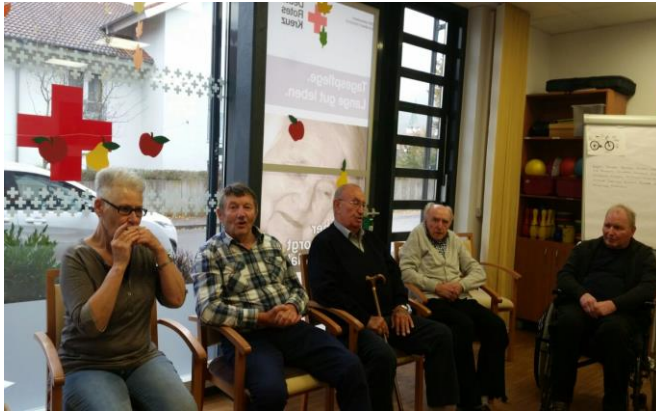
Gemeinsames Singen und Musizieren