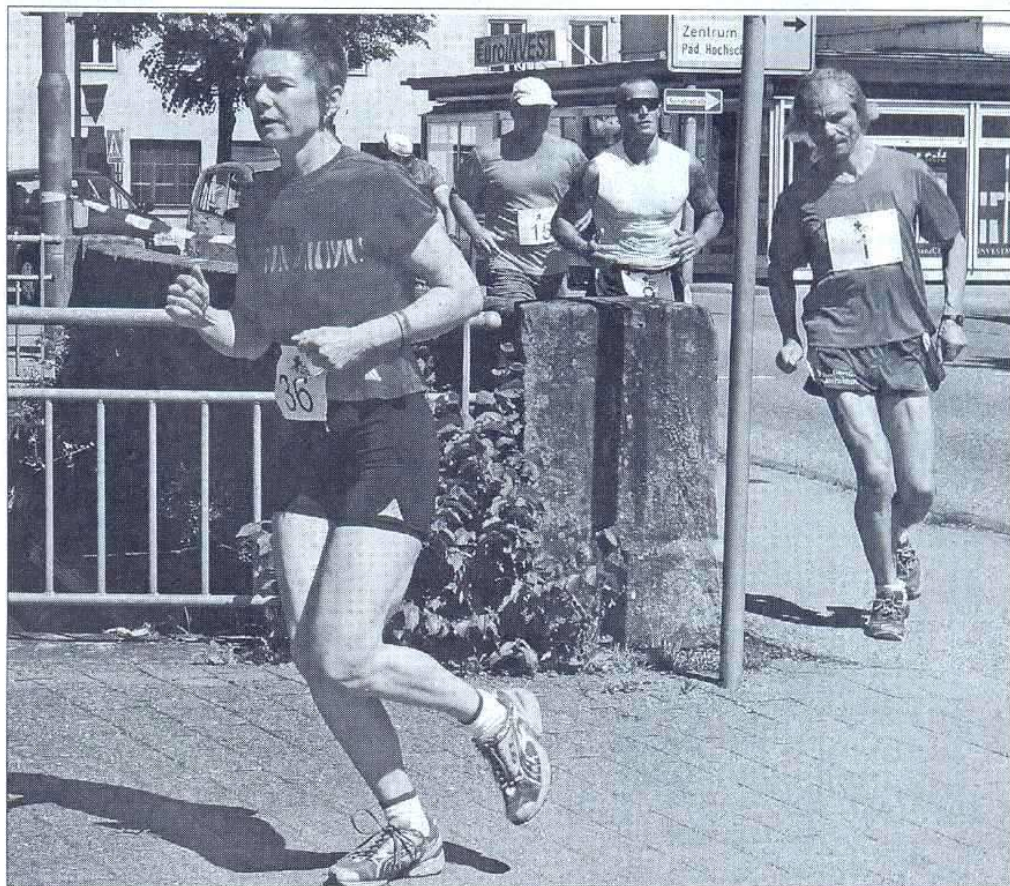
Acht Starter machten beim Zwölf-Stunden-DRK-Lauf keine Pause. Und das, obwohl die Sonne für hohe Temperaturen sorgte.